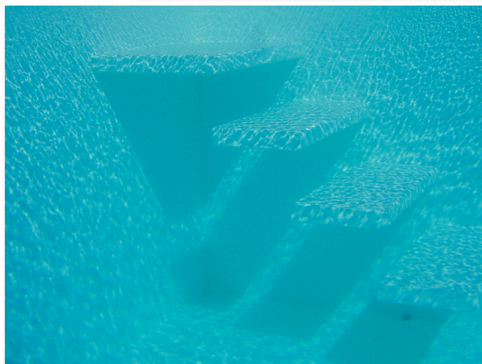
Unterwasseraufnahme von der freischwebenden Stufe“