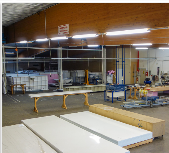
IPoR Produktionshalle in Eferding.